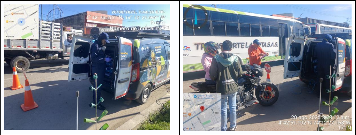
Ilustración No. 1. Operativo pedagógico fuentes móviles.