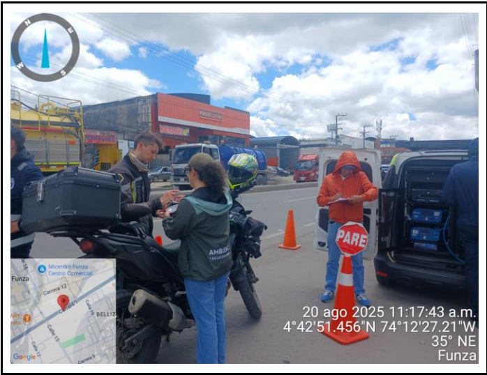
Ilustración No. 3. Operativo pedagógico fuentes móviles.