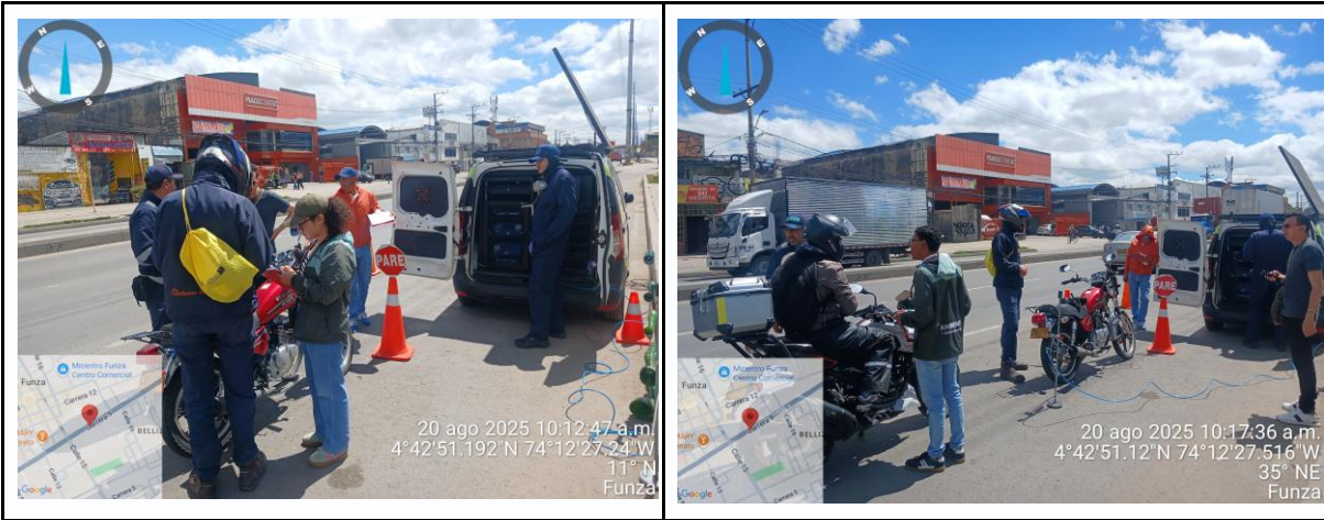
Ilustración No. 2. Operativo pedagógico fuentes móviles.